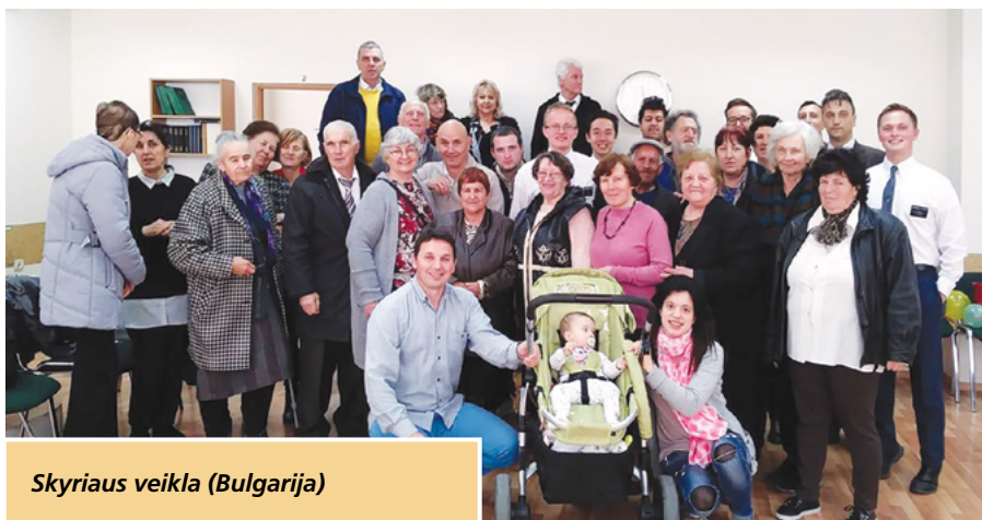
Skyriaus veikla (Bulgarija)

2019 m. kovo 16 d. Pastarųjų Dienų Šventųjų Jėzaus Kristaus Bažnyčios Jambolo grupės susirinkimų namuose (jais naudojasi Sliveno, Jambolo ir Haskovo grupės) įvyko renginys, skirtas norintiems daugiau sužinoti apie Stara Zagora skyriaus narių gimtąsias vietas.