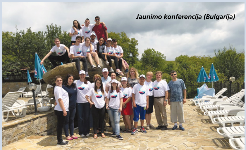
Jaunimo konferencija (Bulgarija)

pirma, aš dvasiškai pasiruošiu misijai. Antra, aš gausiu patriarchalinį palaiminimą. Užbaigusi misiją norėčiau susituokti šventykloje. Žinau, kad jei darysiu savo dalį, Dangiškasis Tėvas viskuo mane laimins. Noriu pasakyti, kad myliu visą jaunimą. Noriu paraginti juos palaikyti vieniems kitus ir padėti spartinti Viešpaties darbą!“ ■