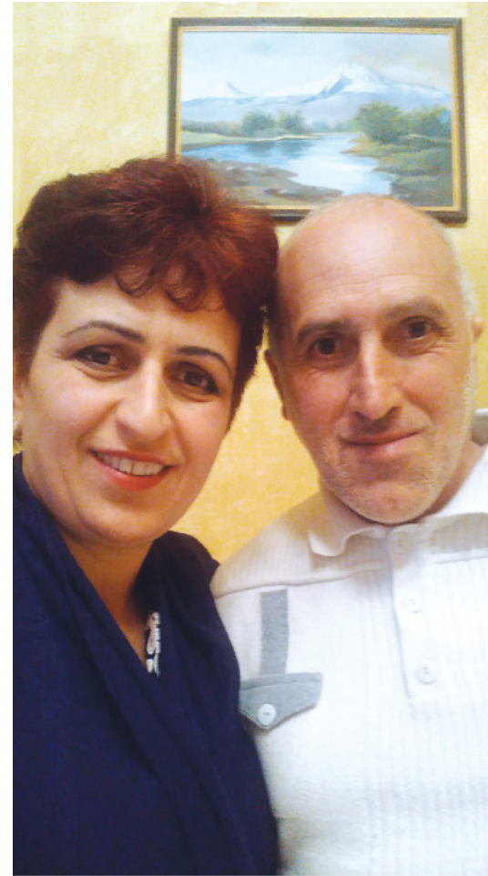
Mamadžanjanų šeima (Armėnija)

Kai iš savo nedidelio atlyginimo mokėjau dešimtinę, Dangiškasis Tėvas