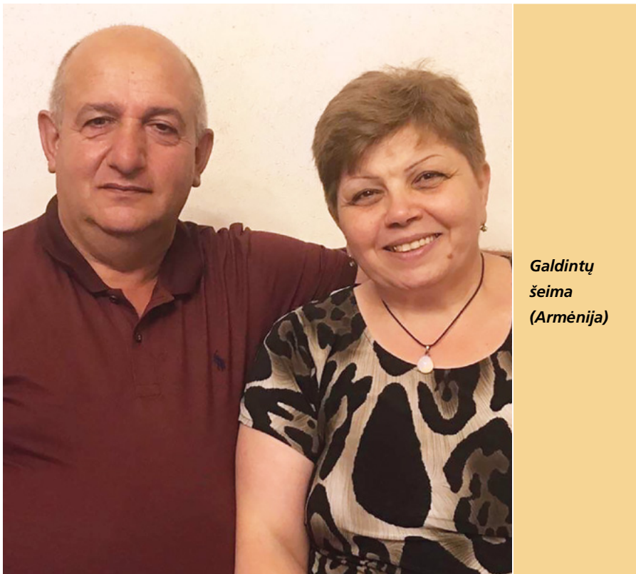
Galdintų šeima (Armėnija)

Kadangi mokėjome visą dešimtinę, mūsų sūnus buvo palaimintas galimybe tarnauti nuolatinėje misijoje.