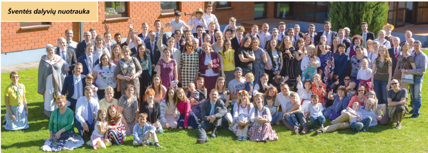
Šventės dalyvių nuotrauka

Per pietų pertrauką šventės dalyviai vaišinosi daugybe su meile pagamintų skanėstų, kuriuos paruošė skyrių nariai. Visų dalyvių vardų norėčiau padėkoti seserims ir broliams, kurie negailėjo savo laiko ir jėgų ir pasirūpino, kad galėtume taip skaniai papietauti. Taip pat dėkoju ir šventės organizatoriams, kurie suteikė galimybę parodyti savo talentus ne tik ruošiant maistą, bet ir dekoruojant patalpas. Salė, kurioje šventėme, buvo išpuošta neužmirš- tuolėmis ir drugeliais. Jie buvo ne tik