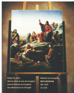
Evangelijos paveikslų knyga

Evangelijos paveikslų knygą, špalvinimo knygelę Evangelijos tema ir Raštų vaikams galite įsigyti tinklalapyje www.store.lds.org . Evangelijos paveikslų knygą galite pažiūrėti tinklalapyje www.lds.org ir per Evangelijos bibliotekos programą.