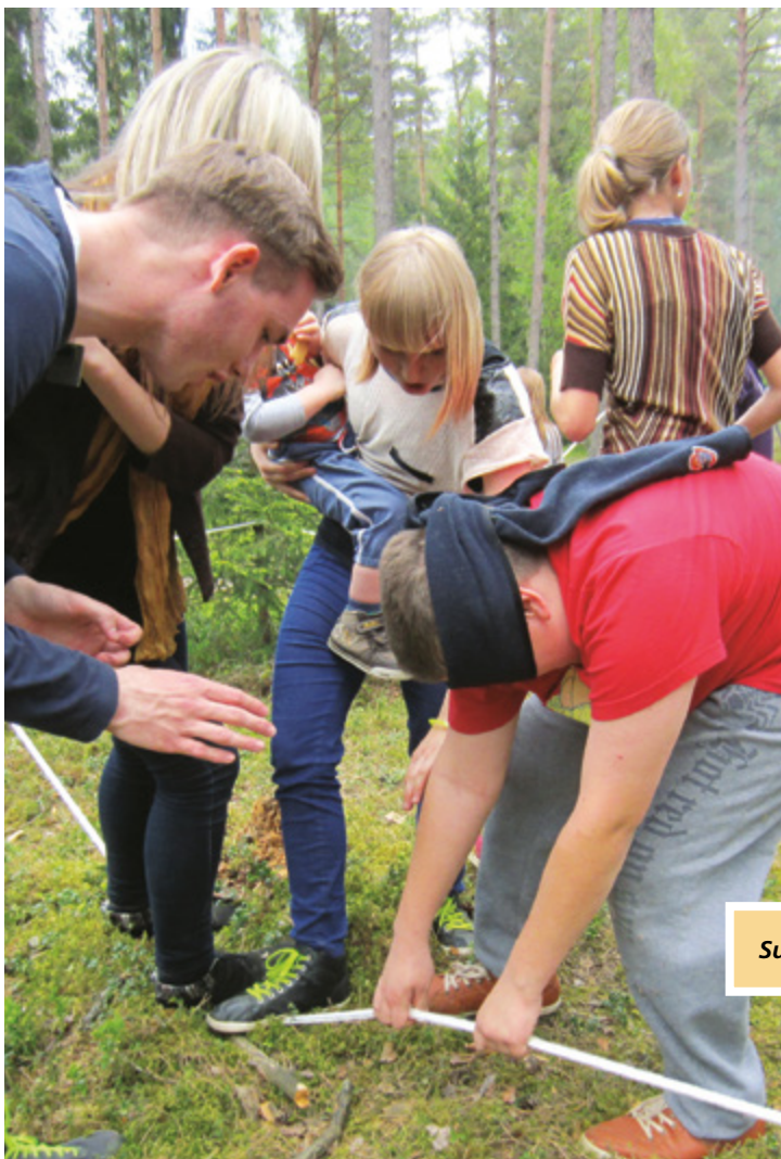
Sunkus kelias į laimę

Kauno skyriaus vadovai paruošė labai prasmingą, lengvai jaunimui suprantamą žaidimą „Laikykis virvės“. Virvė buvo ištempta tarp šakų, tankių eglių ir krūmų, įkišta į padangą, todėl atrodė, kad ji dingsta, ir reikėjo rasti, kur toliau ji tęsiasi. Jaunimui buvo iškeltas reikalavimas – pereiti trasą užrištomis akimis, nepaleisti virvės ir pasiekti finišą. Kiekvienas žaidimo dalyvis turėjo pagalbininkus: vieną draugišką balsą, o kitą klaidinantį, kuždėjusius dalyviams, kaip jie turi elgtis.