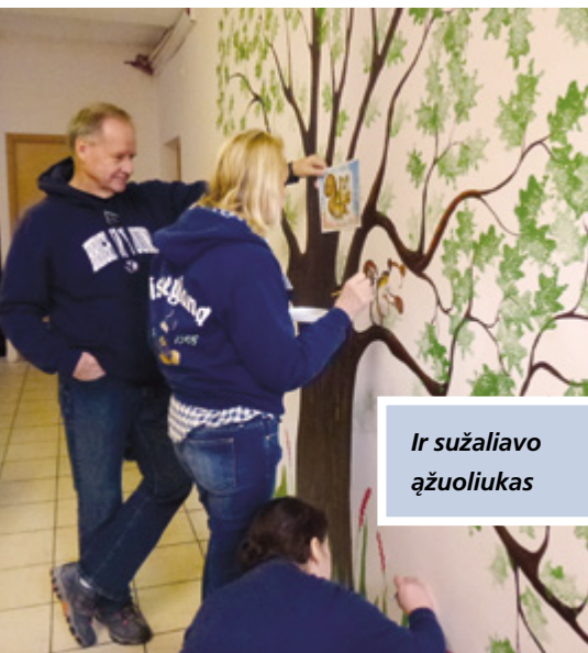
Ir sužaliavo ąžuoliukas

ar negalėtume atsivesti pagalbininkų ir išpiešti tas tuščias sienas. Ši sutiko ir netrukus su keliais Bažnyčios nariais iš vietinių skyrių, anglų kalbos mokytojomis iš Amerikos bei kitais žmonėmis (dalyvavo net keli Bažnyčiai nepriklausantys žmonės) išpiešėme prieangio sienas gėlėmis, drugeliais ir vabzdžiais.