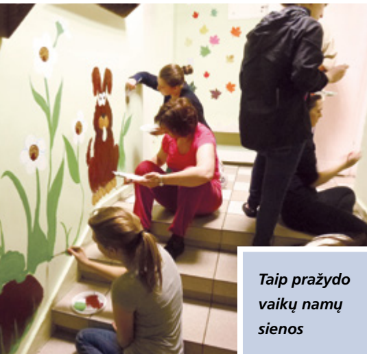
Taip pražydo vaikų namų sienos