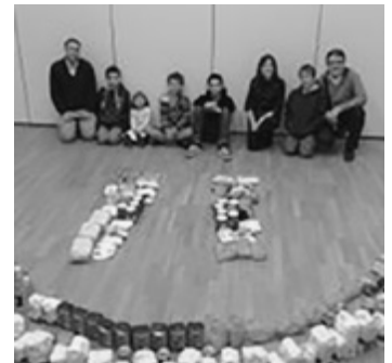
Iš pakuočių sudėliota šypsena – pagalbos akcijos simbolis

Pasaulyje vykdomi švaraus vandens, pagalbos nukentėjusiems nuocunamųjų ir žemės drebėjimų projektai. Darbo drabužiais su užrašu „Mormonų pagalbos rankos“ apsirengę Bažnyčios nariai tvarko aplinką Lietuvoje ir kitose šalyse – ten, kur reikia pagalbos su šypsena. ■