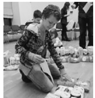
Pakuotės ženklinamos akcijos „Pagalba su šypsena“ lipdukais