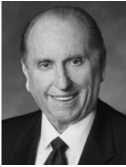
Prezidentas Tomas S. Monsonas