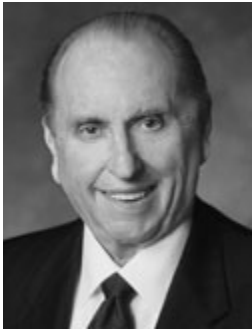
Prezidentas Tomas S. Monsonas