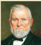
Vilfordas Vudrafas 1887–1898