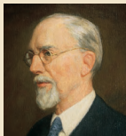
Džordžas Albertas Smitas 1945–1951