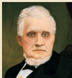
Džonas Teiloras 1877–1887