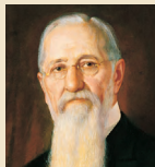
Džozefas F. Smitas 1901–1918