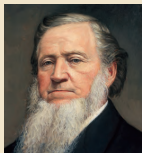
Brigamas Jangas 1844–1877