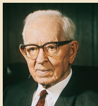
Džozefas Fildingas Smitas 1970–1972