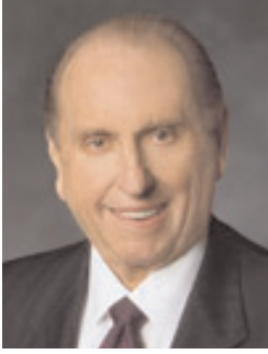
Na Mokambi Thomas S. Monson