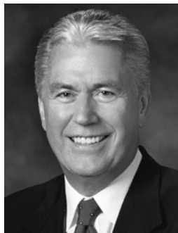
Prezidents Dīters F. Uhtdorfs Otrais padomnieks Augstākajā prezidijā