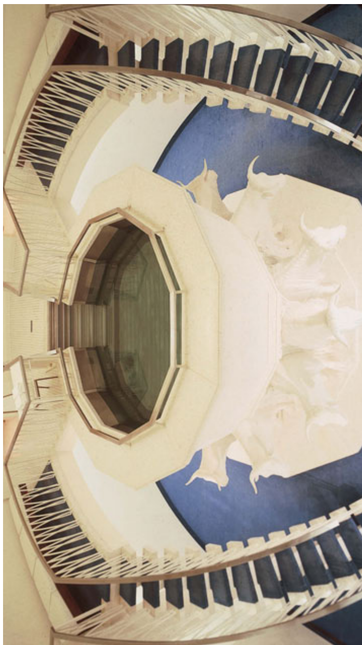
Kristību baseins, Vašingtonas Kolumbijas apg. Tempļis