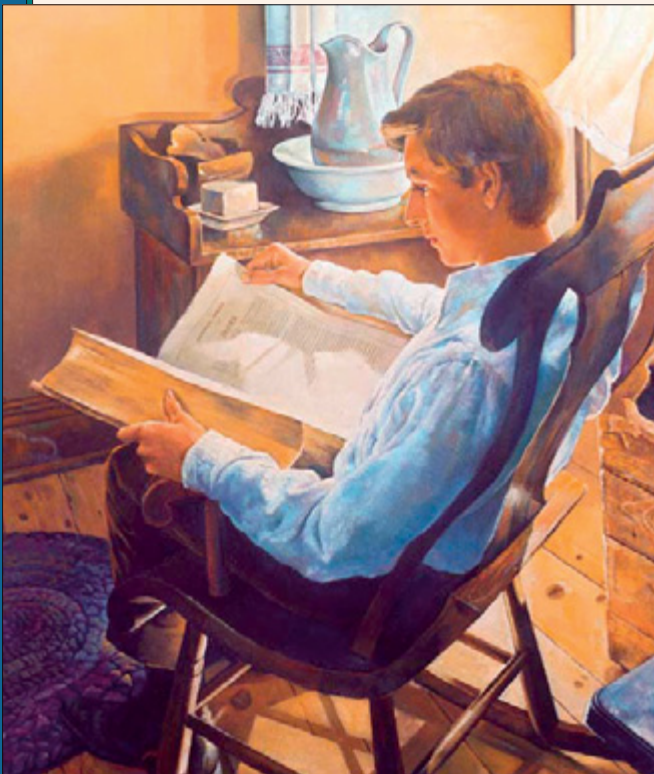
Domādams, kurā baznīcā iestāties, Džozefs meklēja atbildi Bībelē. Tur viņš izlasīja: "Vaicājiet Dievam."

Kopš tās dienas Džozefs kalpoja Dievam, cenšoties nodibināt Pēdējo Dienu Svēto Jēzus Kristus Baznīcu un uzcelt Dieva valstību pēdējās dienās uz zemes. Baznīcas uzticīgie locekļi liecina, ka Jēzus Kristus ir pasaules Glābējs un Pestītājs. Jēzus vada Savu Baznīcu mūsdienās, dodot atklāsmes praviešiem uz