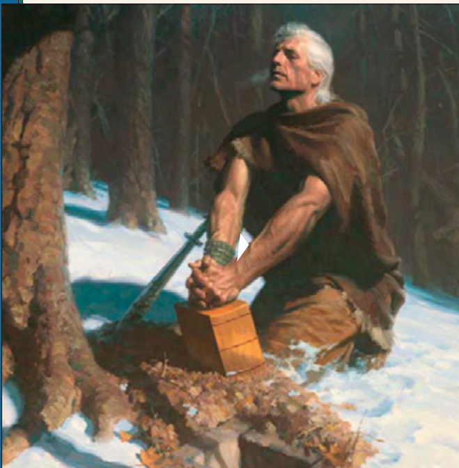
Mūsu ēras 421. gadā pravietis Moronijs noglabāja savu laužu svētos pierakstus Kumoras kalnā. Kad viņš vēlāk atgriezās kā augšamcēlusies būtne, viņš pastāstīja Džozefam Smitam par senajiem pierakstiem, kas ietver evaņģēlija pilnību, kādu to Pestītājs tika nodevis senajiem Amerikas kontinenta iedzīvotājiem. Šie pieraksti ir Mormona Grāmata.

P astāstījis man to, viņš sāka citēt pravietojumus no Vecās Derības. Vispirms viņš citēja daļu no Maleahija grāmatas trešās nodaļas, un tad viņš citēja trešās nodaļas beigas no tā paša