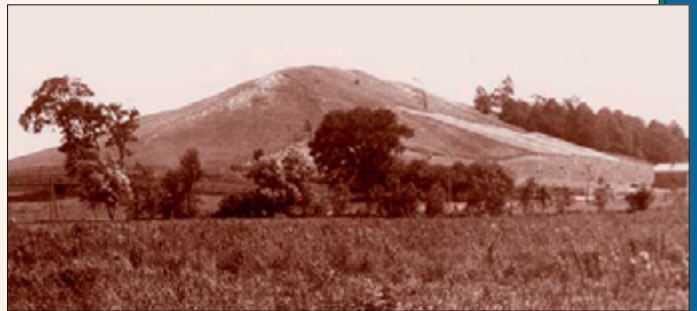
Kumoras kalns atrodas apmēram piecu kilometru attālumā uz dienvidaustrumiem no Smita fermas Palmirā, Nujorkas štatā. Džozefa dzīves laikā tā ziemeļu galu klāja zāle, dienvidu galu—retas koku audzes un meži. Plāksnes bija apraktas dienvidrietumu daļā netālu no virsotnes. Fotoattēls: 1907. gada augusts.

Tobrīd mani iespaidi bija tik dziļi, ka vairs nevarēju aizmigt, un es gulēju izbrīnas pārņemts par visu, ko biju gan redzējis, gan dzirdējis. Bet kāds bija mans pārsteigums, kad atkal ieraudzīju to pašu sūtni pie savas gultas un dzirdēju viņu atstāstām to pašu, piebilstot par brīdinājumu, ka Sātans mani mēģinās kārdināt (tēva ģimenes nabadzīgo apstākļu dēļ), lai es pārdotu zelta plāksnes un kļūtu bagāts. To viņš man aizliedza, sacīdams, ka nedrīkst būt neviens cits nolūks, lai iegūtu zelta plāksnes, kā tikai Dieva slavināšana, un ka neviens cits spēks