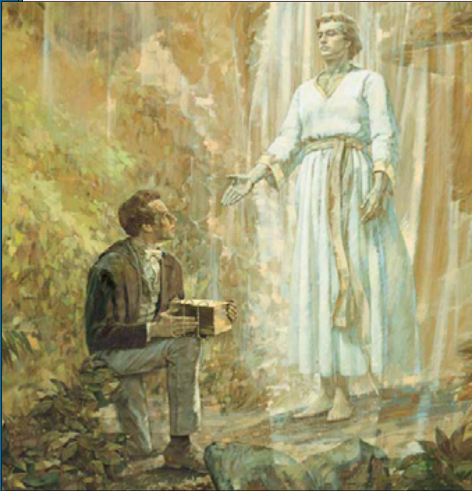
Moronijs atgriezās četras reizes ik pēc gada un deva turpmākos norādījumus jaunajam pravietim. Pēc šiem četriem gadiem Džozefs dabūja plāksnes un sāka tulkot Mormona Grāmatu.

darbus, bet, kad es centos strādāt kā parasti, jutu, ka mans spēks ir zudis un esmu kļuvis pavisam bezspēcīgs. Mans tēvs, kas strādāja blakus, ievēroja, ka ar mani kaut kas nav kārtībā, un teica, lai es ejot mājās. Es sāku iet uz mājām, bet, mēģinot laukā