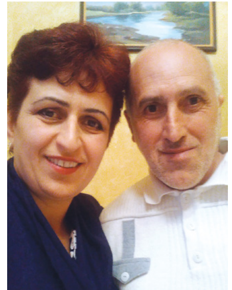
Mamajanjanu ģimene (Armēnija)

Kad es maksāju desmito tiesu no savas mazās algas, Debesu Tēvs izpildīja Savu solījumu, nodrošinot mani