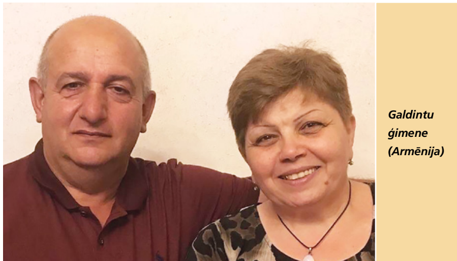
Galdintu ģimene (Armēnija)

Pateicoties pilnas desmitās tiesas maksāšanai, mans dēls tika svētīts ar iespēju kalpot pilna laika misijā. Pirms savas misijas viņš uzrakstīja savu liecību par to, kā desmitās tiesas likums svētīja viņu, tāpēc ka viņš