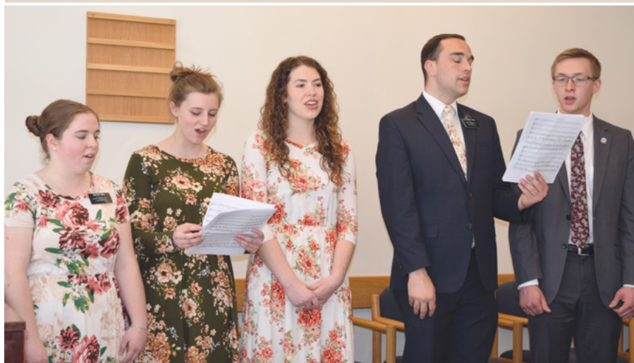
👇 Misionāru uzstāšanās