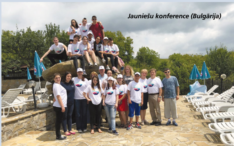
Jauniešu konference (Bulgārija)

es darišu, — sagatavošos garīgi savai misijai. Otrais — saņemšu savu patriarhālo svētību. Pēc kalpošanas misijā es vēlētos apprecēties templī. Es sapratu, ka, ja es darišu savu daļu, Debesu Tēvs mani visā svētīs. Es vēlos pateikt, ka es mīlu visus jauniešus. Es vēlētos viņus aicināt atbalstīt citam citu un sniegt savu artavu, lai Tā Kunga darbs vēl labāk virzītos uz priekšu!” ■