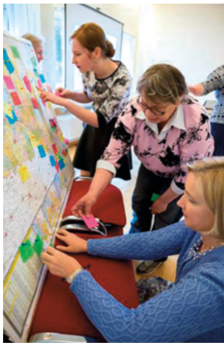
Māsas ar izveidoto karti, kurā norādītas viņu senču dzīvesvietas.