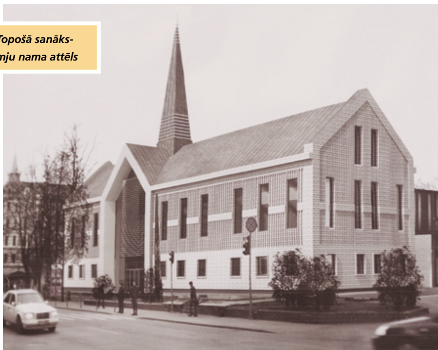
Topošā sanāksmju nama attēls