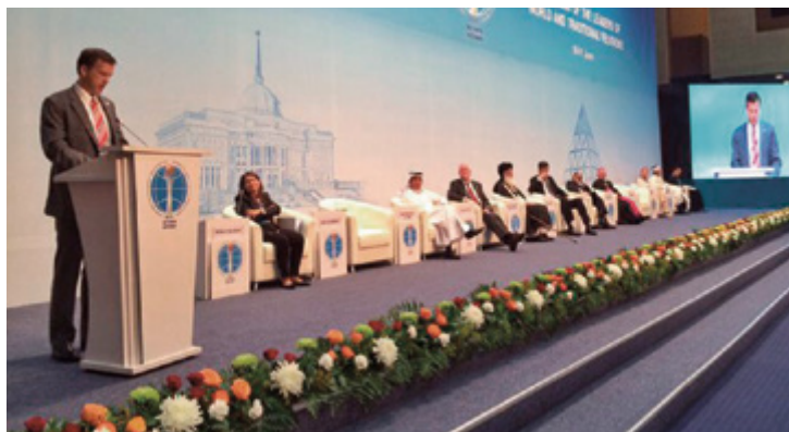
Elders Klebingats uzstājas pasaules reliģiju kongresā

Austrumeiropas Sabiedrisko attiecību departaments