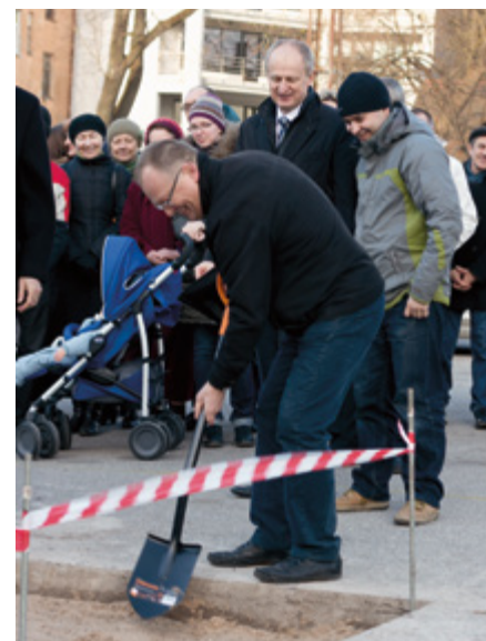
Būvniecības darbu uzsākšanas ceremonijā