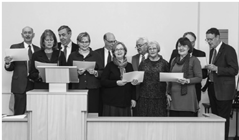
Uzstājas Stokholmas tempļa darbinieki

kad noslēdzās garīgais vakars, visi kopā baudījām zviedru brāļu un māsu sarūpēto cienastu — pi-parkūkas no Zviedrijas un zviedru Ziemassvētku dzērienu. Liels paldies viņiem par to stipro liecību garu, ko viņi atveda no Stokholmas tempļa. ■