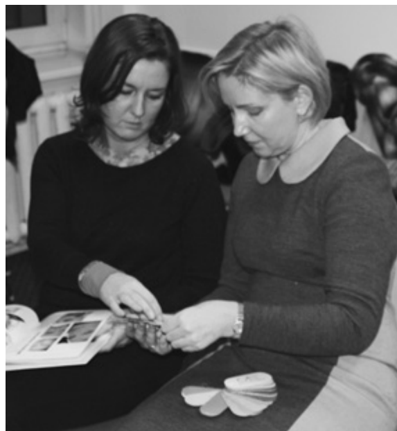
Palīdzības biedrības māsas pasākuma laikā

un nejustos kā svešinieces atgriezoties. Jaunpievērstās māsas lūdzam iepazīstināt ar sevi un uzrakstīt nelielu liecību. Informējam par to, ko mācamies šajā mēnesī, kādi priecīgi notikumi ir mūsu dzīvē, aicinām uz pasākumiem gan Palīdzības biedrībā, gan draudzē. ir arī garīgā doma, kas saistīta ar mūsu ikmēneša izaicinājumu, piemēram, oktobris mums bija tīras valodas mēnesis, novembrī katra centāmi lasīt Svētos Rakstus vismaz 15 minūtes dienā, decembrī, atceroties Jēzus Kristus piedzimšanu, domājam kādu dāvanu,