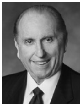
Prezidents Tomass S. Monsons