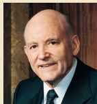
Hovards V. Hanters 1994–1995