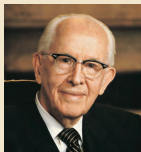
Ezra Tafts Bensons 1985–1994