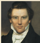
Džozefs Smits 1830–1844