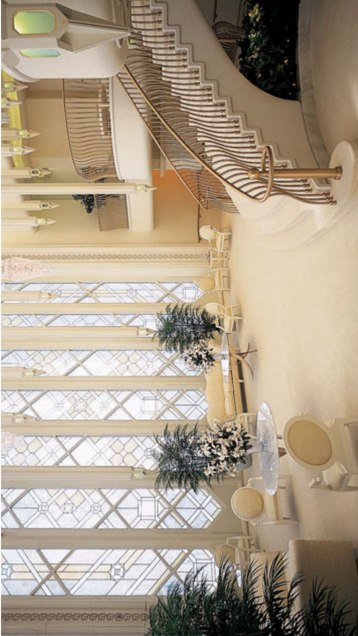
ຫ້ອງອາກາດຂອງສູນ, ພະວິຫານ ແຂວງດິເສໂນ ຄາລິຟໍເນຍ