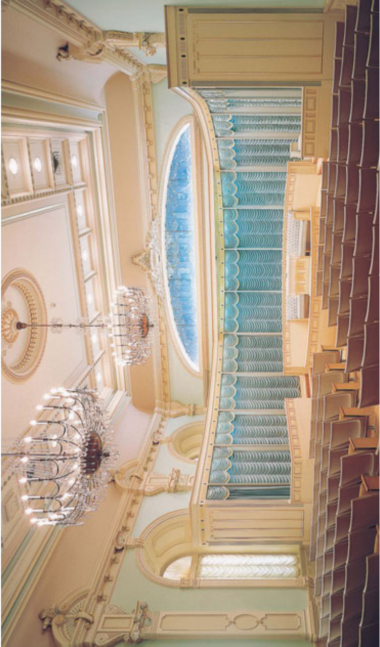
ဗိုလ်ချုပ်မှူးကြီး၏အိမ်ရာ၊ ဘဏ္ဍာရေး ဝန်ကြီးဌာန