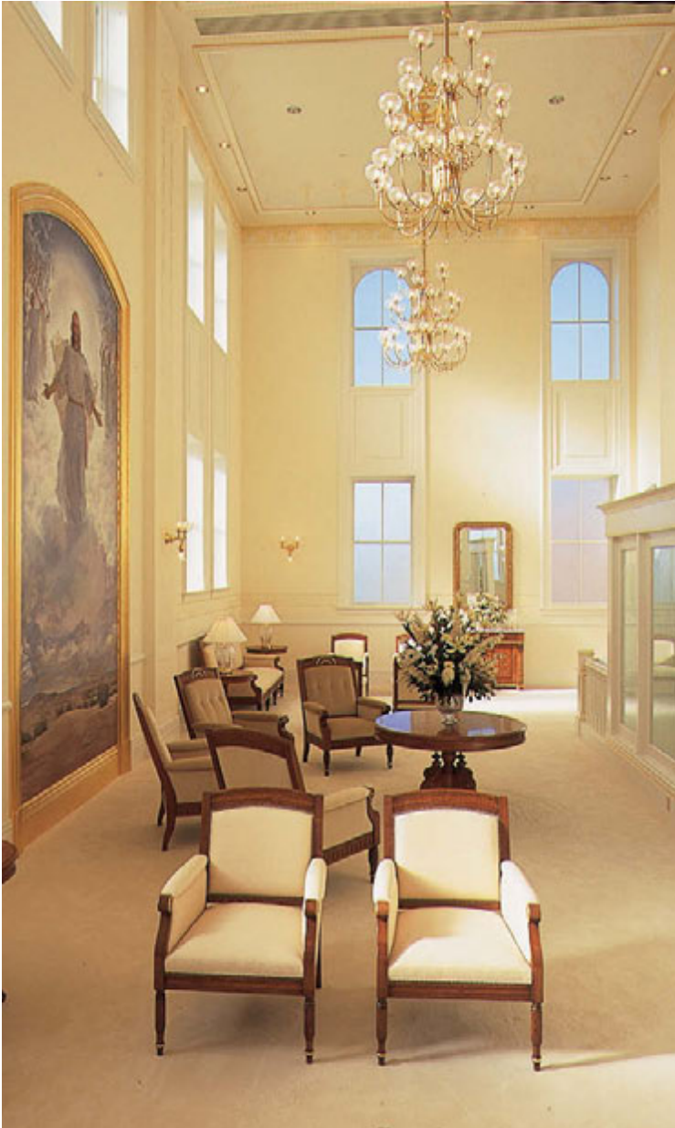
ຫ້ອງອານາຈັກຂຶ້ນສູງ, ພະວິຫານ ເວີນິນ ຢູທາ