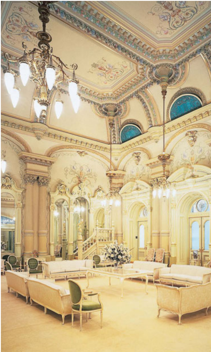
ຫ້ອງອານາຈັກຂັງສູງ, ພະວິຫານ ເຊົາລັກ