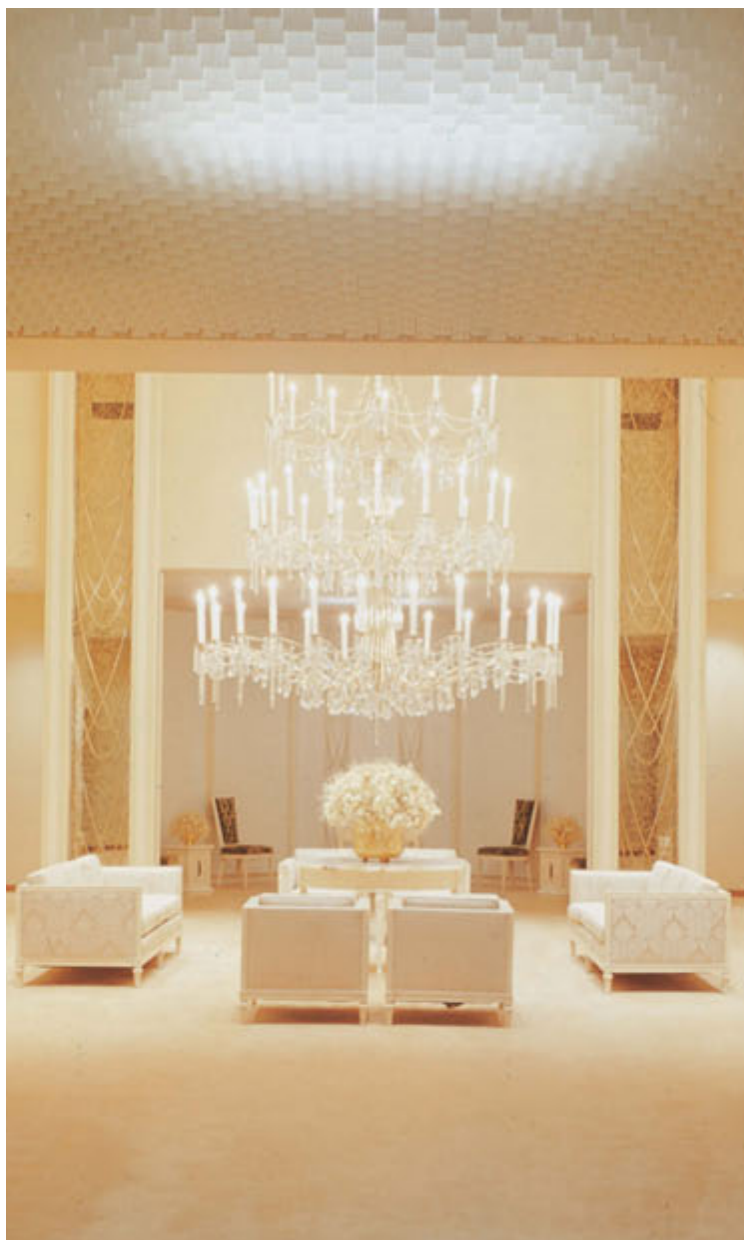
ຫ້ອງອານາຈັກຂຶ້ງສູງ, ພະວິຫານ ໂປໂວ ຢູຫາ