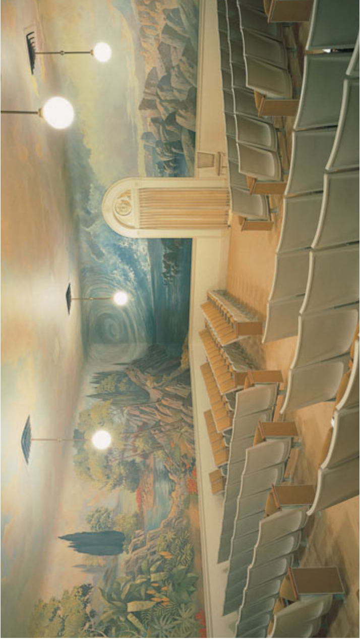
ຫ້ອງແຫ່ງການສ້າງ, ພະວິຫານ ເຊົາເລັກ