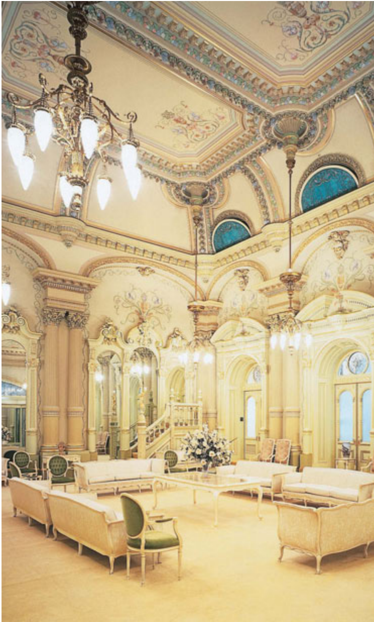
Rum luhn Celestial, Tempuhl Salt Lake