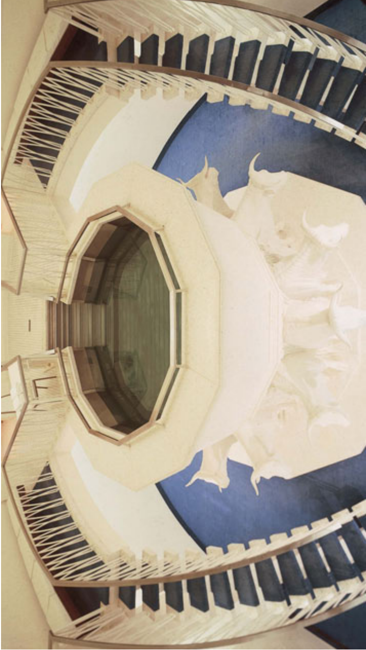
Act in Pacptais, Tempuhl Washington D.C.