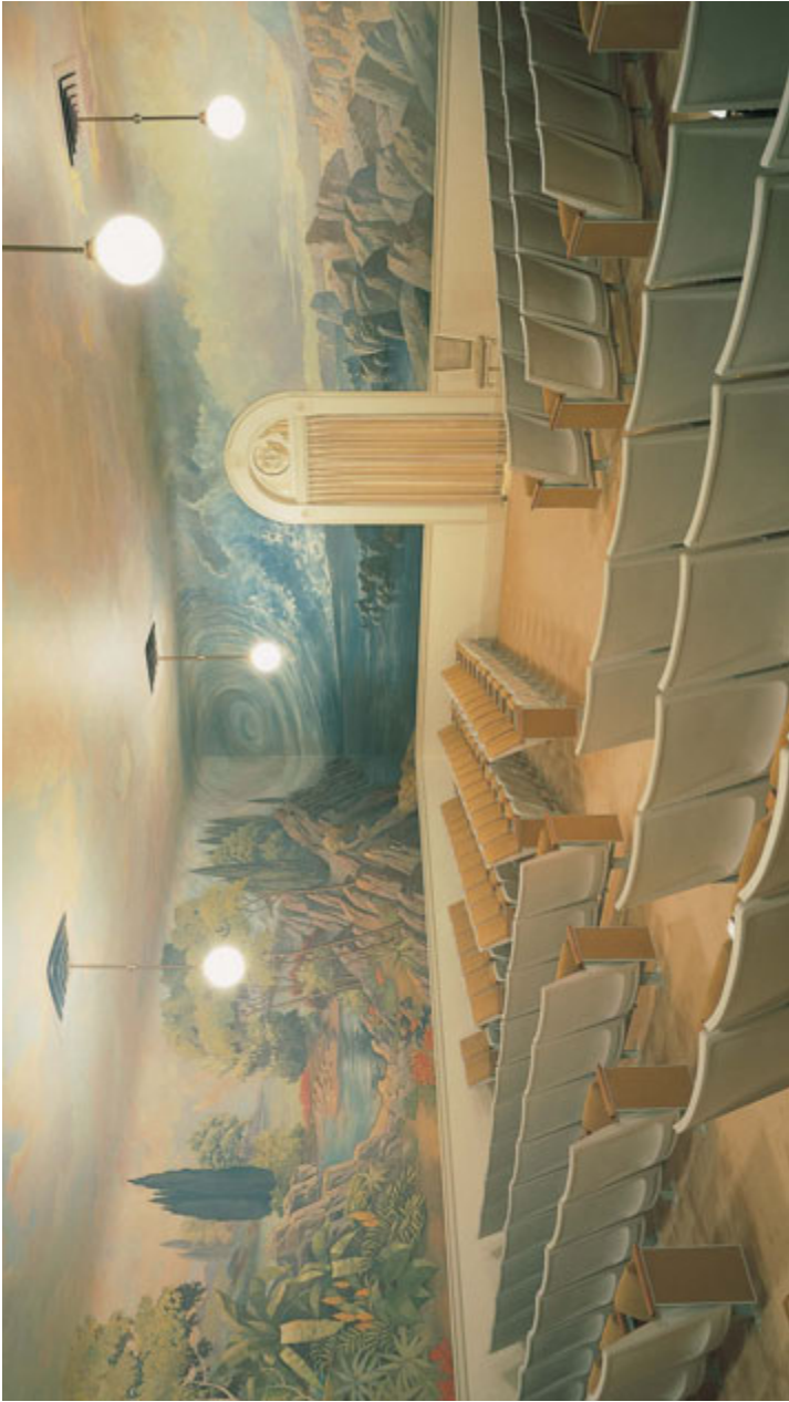
Rum ke oreklac Iuhm factulu, Tempuhl Salt Lake