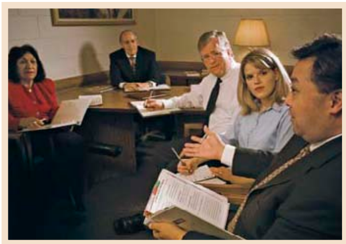
와드 평의회는 감독의 지시에 따라 복지와 관련된 필요 사항을 해결하는 일에 도움을 준다.