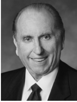
Ni Presidente Thomas S. Monson