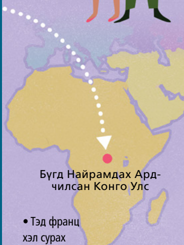
Бүгд Найрамдах Ардчилсан Конго Улс