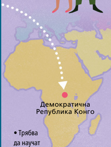
Демократична Република Конго