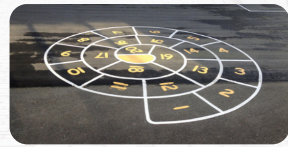
Французьким дітям подобається грати у гру під назвою "escargot". Ви стрибаєте по спіралі, щоб дістатися до її кінця.

Ви з Франції? Пишіть нам! Ми будемо раді отримати вашого листа!