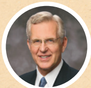
OUDERLING DALE G. RENLUND