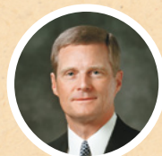
OUDERLING DAVID A. BEDNAR