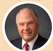
OUDERLING RONALD A. RASBAND