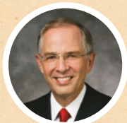
OUDERLING NEIL L. ANDERSEN