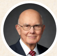
PRESIDENT DALLIN H. OAKS

1e raadgever steunverlening als apostel: 1984