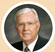
PRESIDENT M. RUSSELL BALLARD