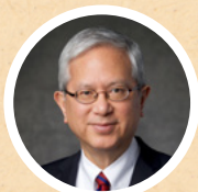
OUDERLING GERRIT W. GONG