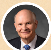
OUDERLING DALE G. RENLUND