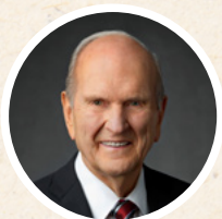
PRESIDENT RUSSELL M. NELSON

1e raadgever steunverlening als apostel: 1984