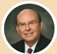
OUDERLING QUENTIN L. COOK