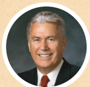
OUDERLING DIETER F. UCHTDORF