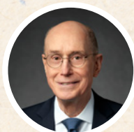
PRESIDENT HENRY B. EYRING

President van de kerk steunverlening als apostel: 1984