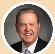
OUDERLING JEFFREY R. HOLLAND