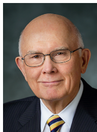
Par Dallin H. Oaks du Collège des douze apôtres