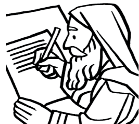
TE MAU PĀPĀ'IRA'A MO'A