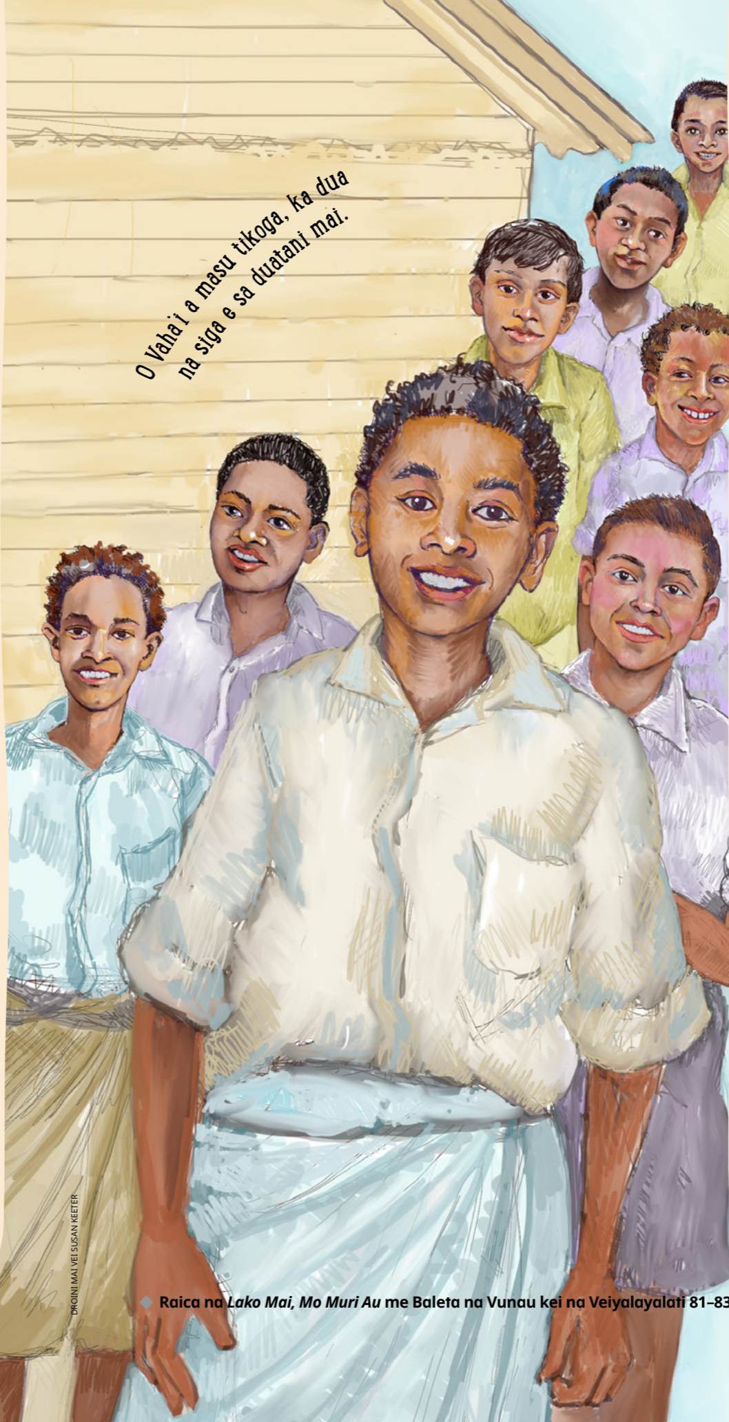
DRONINI MAI VEI SUSAN KEETER

O Vaha'i a masu tikoga, ka dua na siga e sa duatani mai.