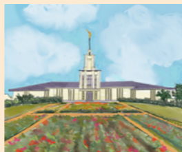
A veiqaravi vaka peresitedi ni Valetabu e Nukualofa Toga o koya.