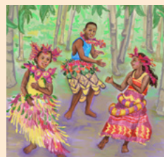
E kilai talega o Toga me "Yanuyanu Mamarau."

A tekiduru o Vaha'i ena yasa ni nona idavodavo me cavuta na nona masu. E a imatai ni nona bogi e koronivuli curu i bure, ka wasea e dua na rumu kei na vuqa tale na gonetagane. E sega ni dua vei ira e lewe ni Lotu i Jisu Karisito ni Yalododonu Edaidai, me vakataki koya.