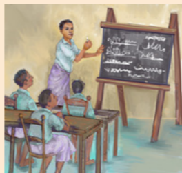
E a qasenivuli ena koronivuli na Liahona College, e dua na koronivuli ni Lotu torocake e Toga.

O Vaha'i a masu tikoga, ka dua na siga e sa duatani mai.