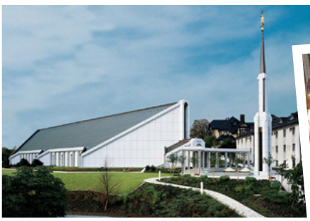
Temppeli oli suljettu remontin vuoksi. Sen jälkeen se piti vihkiä uudelleen.

Apostolit palvelevat ihmisiä eri puolilla maailmaa ja opettavat heille Jeesuksesta Kristuksesta.