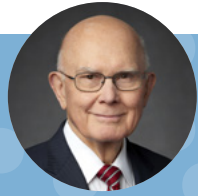
Saunia e Peresitene Dallin H. Oaks Fesoasoani Muamua i le Au Peresitene Sili