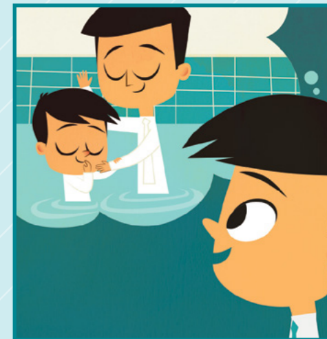
波波等不及他受洗的那一天。