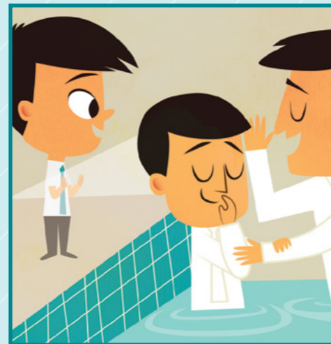
時間到了！爸爸走進水裡。波波仔細看。