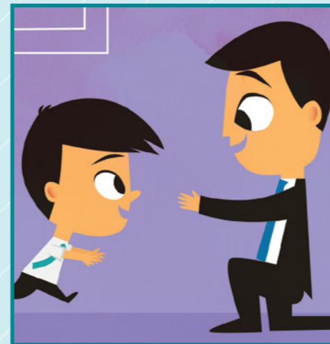
波波好開心，他給爸爸一個大大的擁抱。