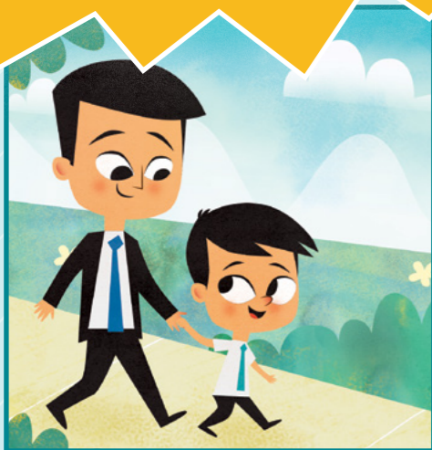
今天是個大日子，爸爸要受洗了。