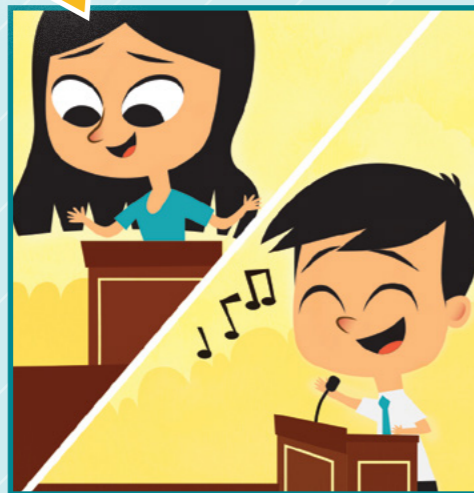
楊姊妹作演講，波波唱了一首歌。