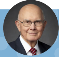
Presidentti Dallin H. Oaks ensimmäinen neuvonantaja ensimmäisessä presidenttikunnassa