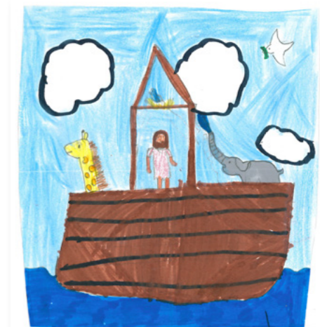
Aja S. (9), Queensland (Australië)