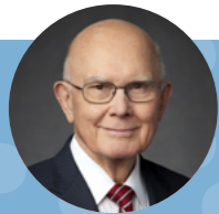
Præsident Dallin H. Oaks Førsterådgiver i Det Første Præsidentskab