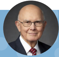
Por el presidente Dallin H. Oaks Primer Consejero de la Primera Presidencia