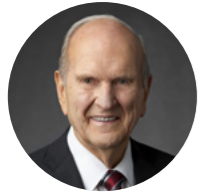
Av president Russell M. Nelson