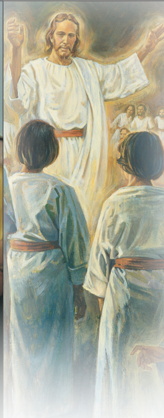
ពិភពវិញ្ញាណ