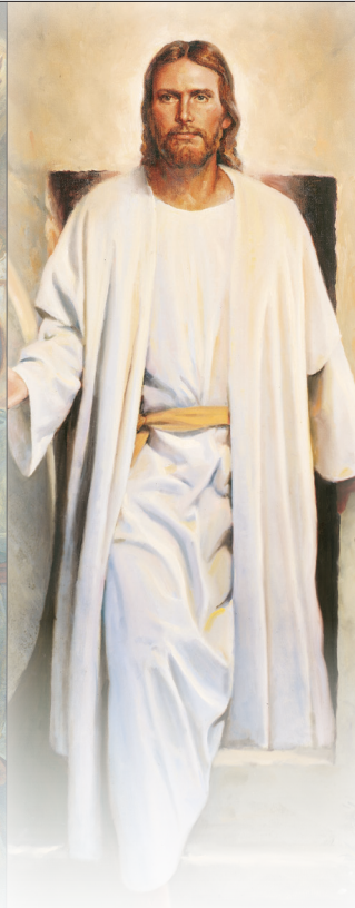
ការរស់ឡើងវិញ និងការជំនុំជម្រះ

គោលលទ្ធិ និងសេចក្តីសញ្ញា ២៩:១២-១៣, ២៦-៣០