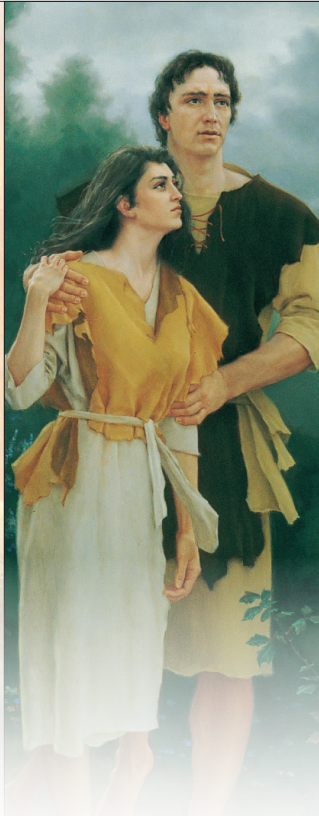
ការបង្កបង្កើត និងការធ្លាក់ចុះ

គោលលទ្ធិ និងសេចក្តីសញ្ញា ២៩:៣១-៣៣; ៤០-៤១