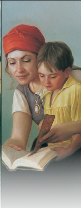
ជីវិតរមែងស្លាប់

គោលលទ្ធិ និងសេចក្តីសញ្ញា ២៩:៣១-៣៣; ៤០-៤១