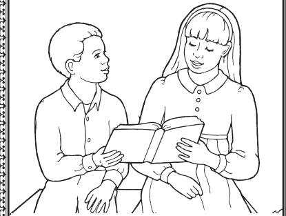
... hufurahia katika ukweli.