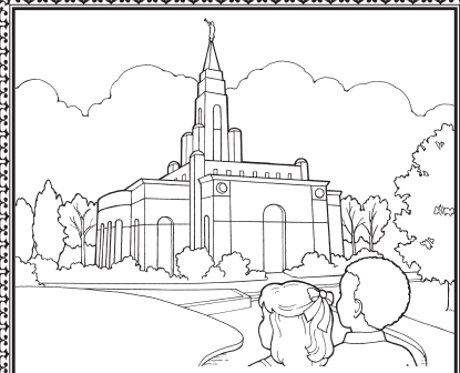
... haifikirii uovu.