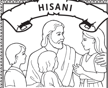
Upendo msafi wa Kristo.