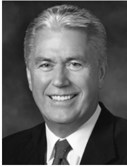
Ni Presidente Dieter F. Uchtdorf Maikadua a Mammagbaga iti Umuna a Panguluén