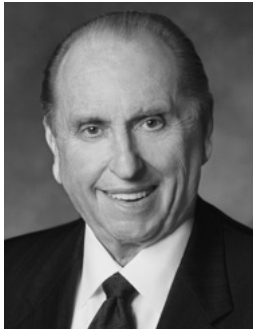
Ni Presidente Thomas S. Monson