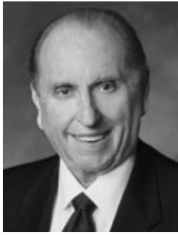
Ni Presidente Thomas S. Monson