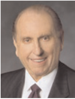
Thomas S. Monson forseti