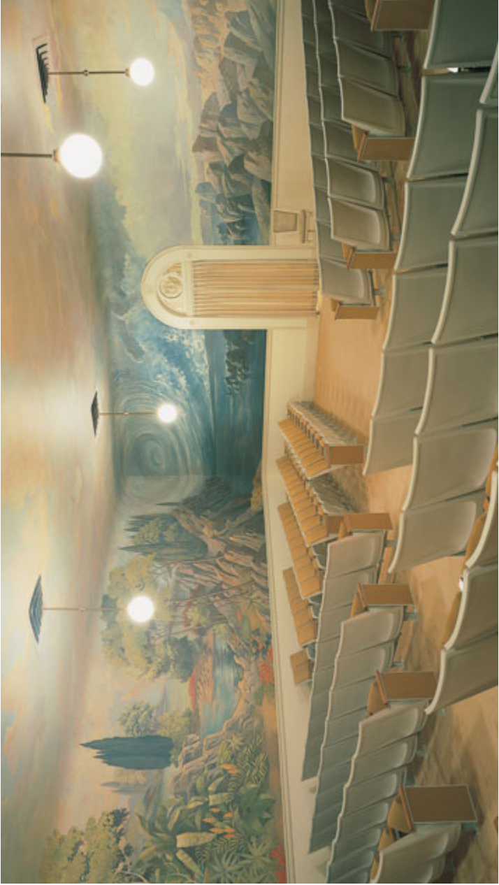
Chav Ntuj Tsim Teb Raug, Salt Lake lub Tuam Tseu