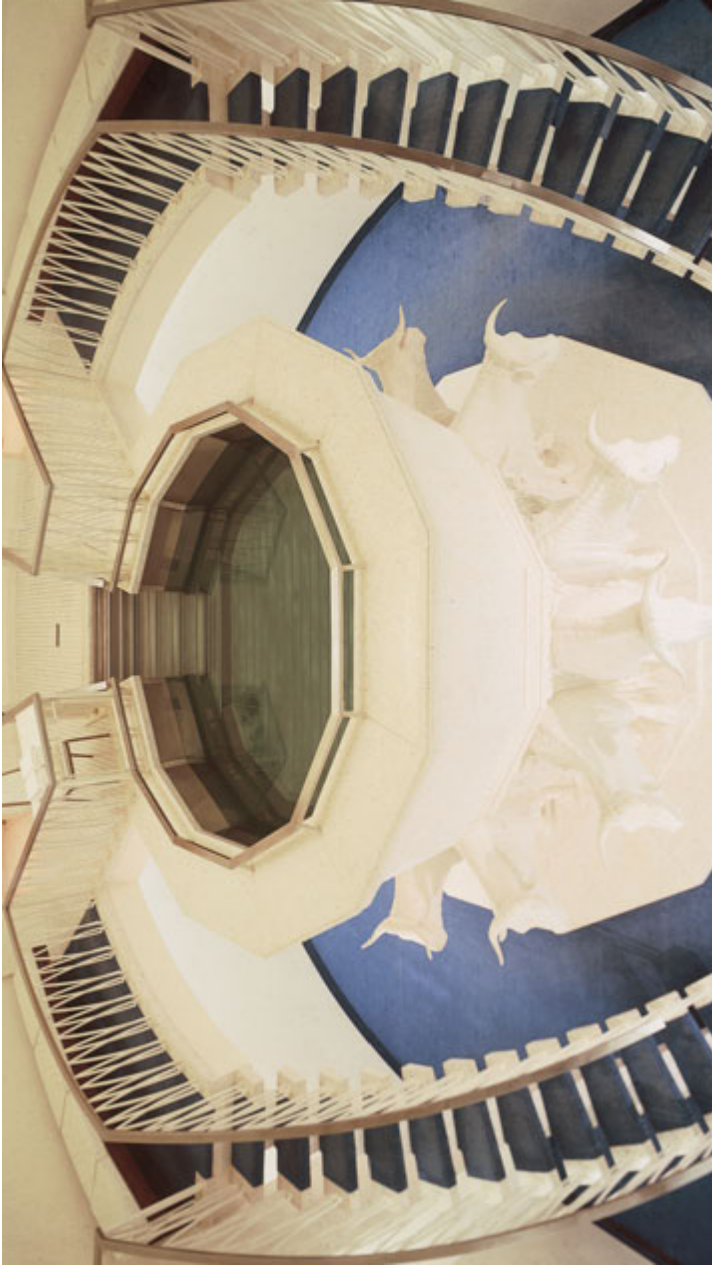
Lub Dab Rau Kev Cai Raus Dej, Washington D. C. Iub Tuam Tsev