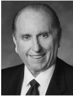
Los ntawm Thawj Tswj Hwm Thomas S. Monson