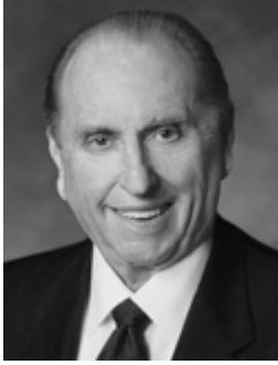
Los ntawm Thawj Tswj Hwm Thomas S. Monson