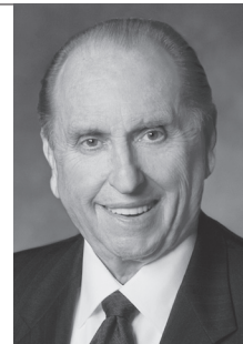
Los ntawm Thawj Tswj Hwm Thomas S. Monson