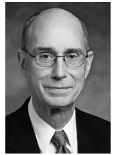
Prezidan Henry B. Eyring Premye Konseye nan Premye Prezidans lan