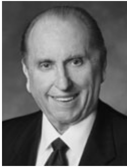
Pa Prezidan Thomas S. Monson