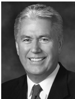
Από τον Πρόεδρο Ντίτερ Ούχτντορφ Δεύτερο Σύμβουλο στην Πρώτη Προεδρία