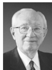
Πρεσβύτερος Γκόρντον Χίνκλι