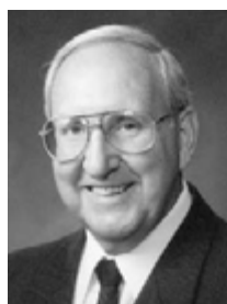
Πρεσβύτερος Βον Φέδεροτσου