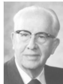
Πρόεδρος Έζρα Ταφτ Μπένσον

Πρόεδρος της Απαρτίας των Δώδεκα Αποστόλων