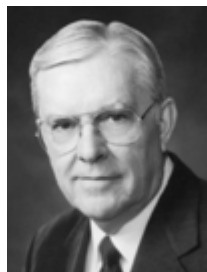
Πρεσβύτερος Ράσελ Μπάλαρντ

Ξέρω ότι ο Θεός ξει και ότι ο Ιησούς είναι ο Χριστός. Ξέρω ότι μπορούμε να επιτύχουμε το έργο τους καλύτερα μέσω ενότητας και αγάπης καθώς συσκεπτόμαστε μεταξύ αλλήλων. Είθε να είμαστε ευλογημένοι να το κάνουμε αυτό, είναι η ταπεινή προσευχή μου, στο όνομα του Ιησού Χριστού, αμήν.