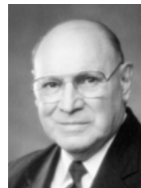
Πρεσβύτερος Τζόζεφ Γουέρθλιν